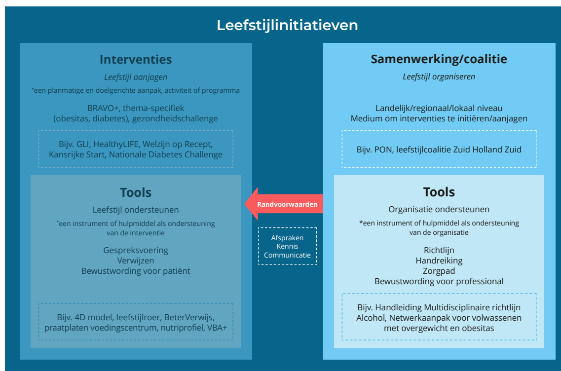
Afbeelding 2: Nadruk van interviews op rechterkant theoretisch kader

In totaal zijn er 6 interviews gehouden via Microsoft Teams, van elk ongeveer één uur. De interviews dienden om een beeld te geven van de visie en rol van de branche-/beroepsverenigingen als het gaat over leefstijlinitiatieven en tools, en de informatieverstrekking hierover richting hun leden. Hierbij lag de focus voornamelijk op de rechterkant van ons eerder toegelichte model (zie Afbeelding 2). Ook hebben we aandacht besteed aan de interventies en tools die de leden van de branche-/beroepsverenigingen gebruiken en de rol die de branche-/beroepsverenigingen hebben op het faciliteren van dit inhoudelijke aspect van leefstijl.